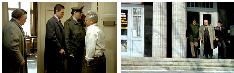
ALLES AUF ZUCKER!